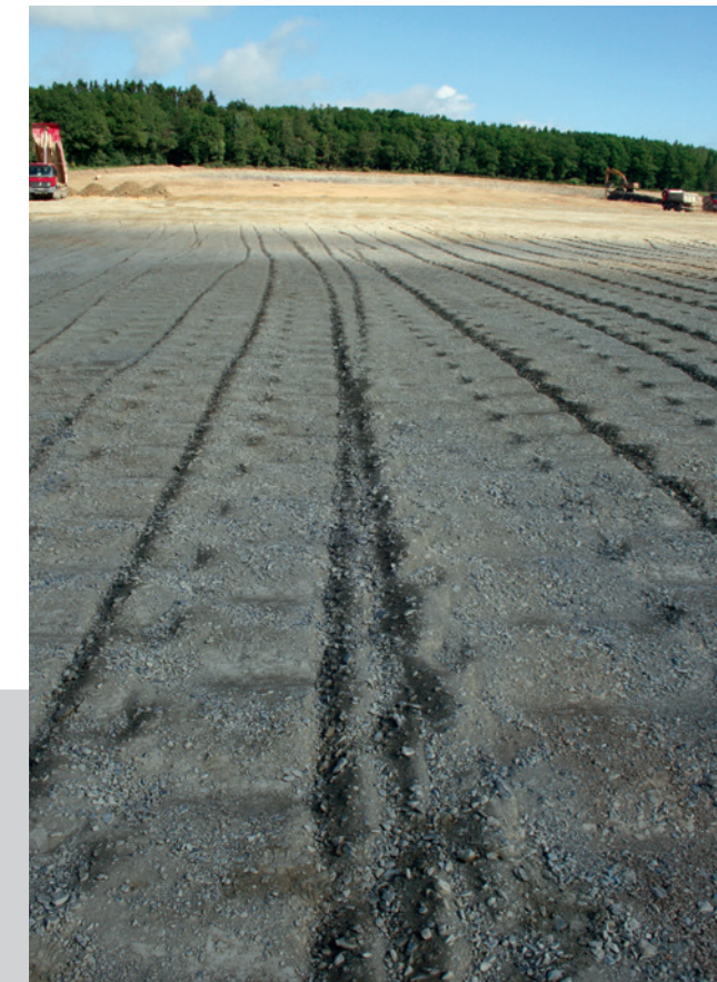
Walzenspur Polygonwalze, Bomag BW 226 DI, Erweiterung Gewerbegebiet Humos, Morbach

Unser hochmotiviertes Team aus Ingenieuren, leistungsfähigen Maschinisten und Facharbeitern vereint Know-how aus allen Leistungsbereichen des Tiefbaus unter einem Dach. Hoher Anspruch und Termindruck stellen dabei für uns keinen Widerspruch dar.