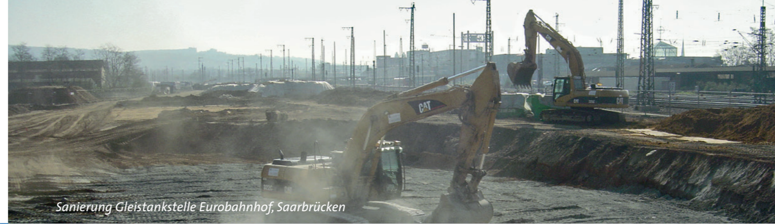
Sanierung Gleistankstelle Eurobahnhof, Saarbrücken

Wir bewegen etwas, als Ihr starker Partner für Erd- und Tiefbau