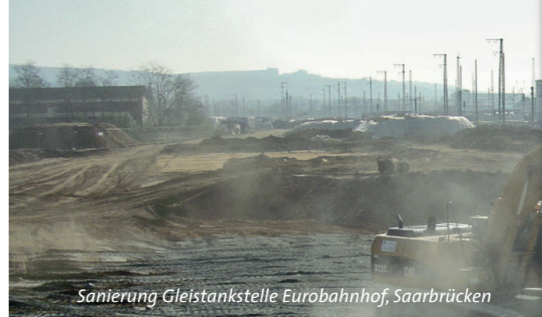
Sanierung Gleistankstelle Eurobahnhof, Saarbrücken

Unser hochmotiviertes Team aus Ingenieuren, leistungsfähigen Maschinisten und Facharbeitern vereint Know-how aus allen Leistungsbereichen des Tiefbaus unter einem Dach. Hoher Anspruch und Termindruck stellen dabei für uns keinen Widerspruch dar.