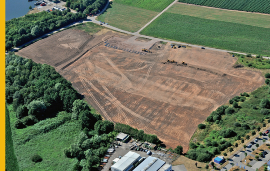
Erschließung Gewerbepark Rundwies, Dillingen