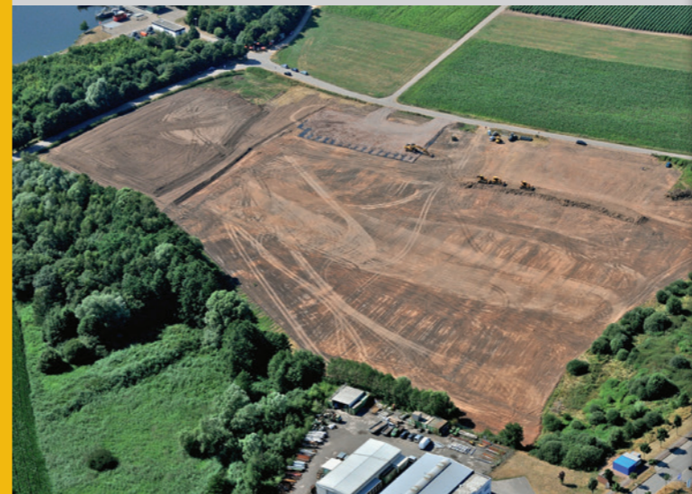
Erschließung Gewerbepark Rundwies, Dillingen

Einerseits ein moderner Maschinenpool und Menschen, die damit höchst professionell arbeiten, andererseits Ingenieure, die komplexe Aufgaben im Tiefbau zu lösen wissen – das ist unser Rezept. Von A wie Auffüllung über H wie Hangsicherung bis Z für Zementverfestigung