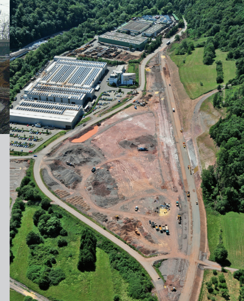
Umverlegung der L 145, Schmelz-Limbach